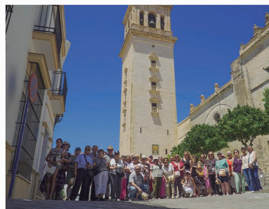
Visita a Lebrija.