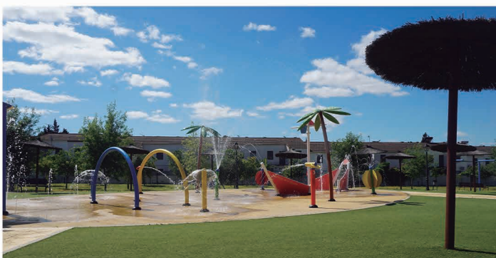
Juegos de agua del Parque del Parlamento. Horario: de Lunes a Domingo de 11:30h a 14:30h y de 17:30h a 21:00h.