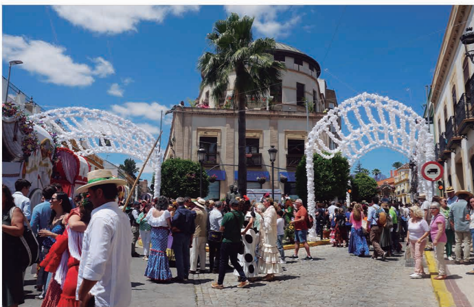
Paseo de las Carretas del Rocío.