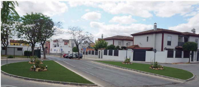
Rotonda en la Avenida Donantes de Sangre y de Órganos.