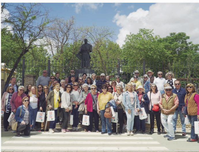
Visita a Coria del Río.