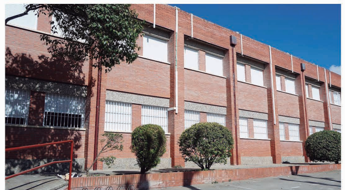
CEIP Luis Cernuda.