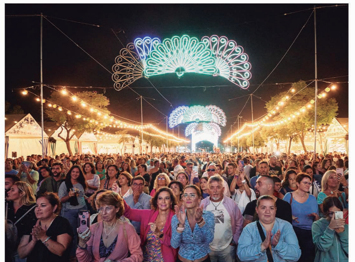
Miles de personas disfrutaron de los conciertos gratuitos.