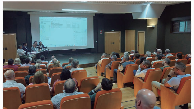
Encuentro con vecinos/as.

Este proceso abierto ha sido posible gracias a una subvención de la Diputación de Sevilla, a la que se han acogido 72 de los 106 municipios de la provincia, para llevar a cabo la actualización de su planeamiento urbanístico.