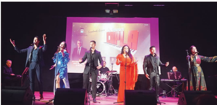
Se llama coplá El Reencuentro .