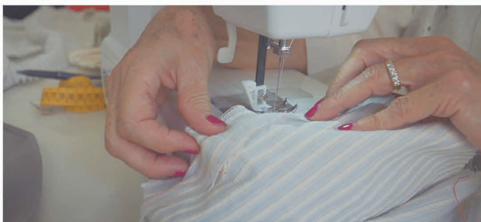
Taller de costura.