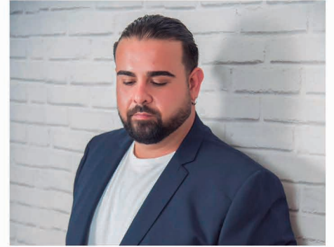
Rafael Ruiz 'El Bomba'.

Castilleja de la Cuesta se prepara ya para uno de los eventos más esperados del año: su Feria. Entre el 12 y el 15 de septiembre, el recinto ferial volverá a llenarse de música y buen ambiente de la mano de un gran plantel de artistas: Rosa, OBK, El Bomba y la Chirigota del Bizcocho ya están confirmados.