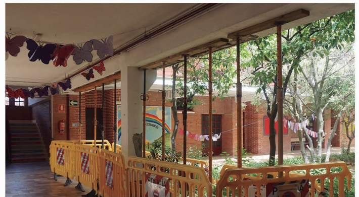
Una de las zonas afectada del colegio.

“Tras las reuniones mantenidas con representantes de la Delegación Territorial de Educación y tras presentarles estos informes, se han mostrado inamovibles, por lo que será el Ayuntamiento quien solvente este problema por el bien de la comunidad educativa del colegio” , ha explicado Herrera, que ha anunciado que estas obras se desarrollarán este verano.