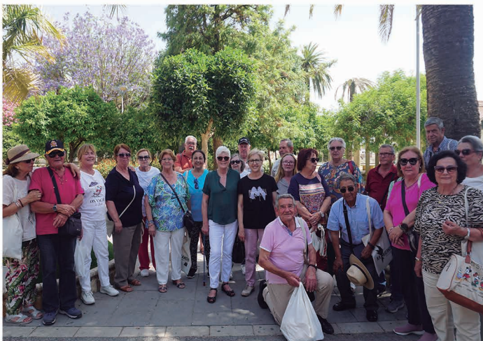
Visita a Morón de la Frontera.

Asimismo, el Ayuntamiento organiza también visitas culturales a municipios de la provincia, para que vecinos y vecinas puedan conocer la riqueza patrimonial e histórica de Sevilla. Ya han podido visitar Coria del Río, Lebrija y Morón de la Frontera entre otros.