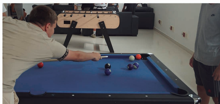
Nueva mesa de billar.

Las salas de estudio de Castilleja de la Cuesta acogen una media mensual de 200 usuarios