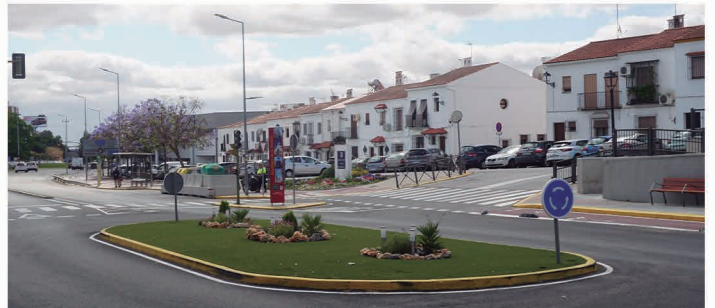
Glorieta de acceso a Aljaportil en la Avenida de Sevilla.

fondos de la Diputación de Sevilla, no sólo han modernizado espacios, entornos y acerados, sino que han supuesto la reordenación de las señales, para responder a la densidad de tráfico que circula por estas vías.