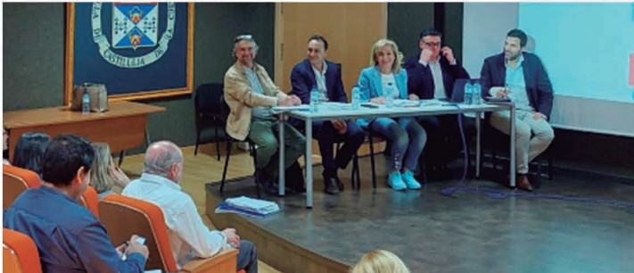
Reunión con la Corporación Municipal.

E l Ayuntamiento ha iniciado la elaboración del nuevo Plan General de Ordenación Municipal que definirá el futuro urbanístico del municipio. El pasado mes de abril se celebraron varias mesas informativas, como parte del proceso para la elaboración del nuevo PGOM, con técnicos municipales, con miembros de la Corporación y con vecinos y vecinas.