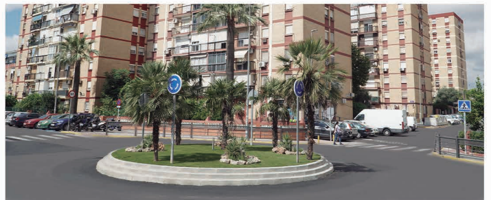
Rotonda en la Avenida Juan Carlos I.