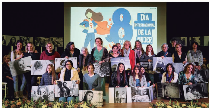
Foto de familia de todas las mujeres homenajeadas en el 8 de marzo.

Estas 21 mujeres formaron parte de la VIII edición de la exposición 'Con rostro de mujer' que fue inaugurada el mismo 8 de marzo en este acto homenaje, celebrado en el Teatro Municipal Hermanos Reyes. "Qué verdad es que Castilleja de la Cuesta puede sentirse tremendamente orgullosa de las mujeres que se levantan cada día para hacer este pueblo mejor. Hoy sólo nos acompañan una pequeña representación pero sirva este homenaje para todas ellas en este día tan señalado", aseguró Herrera.