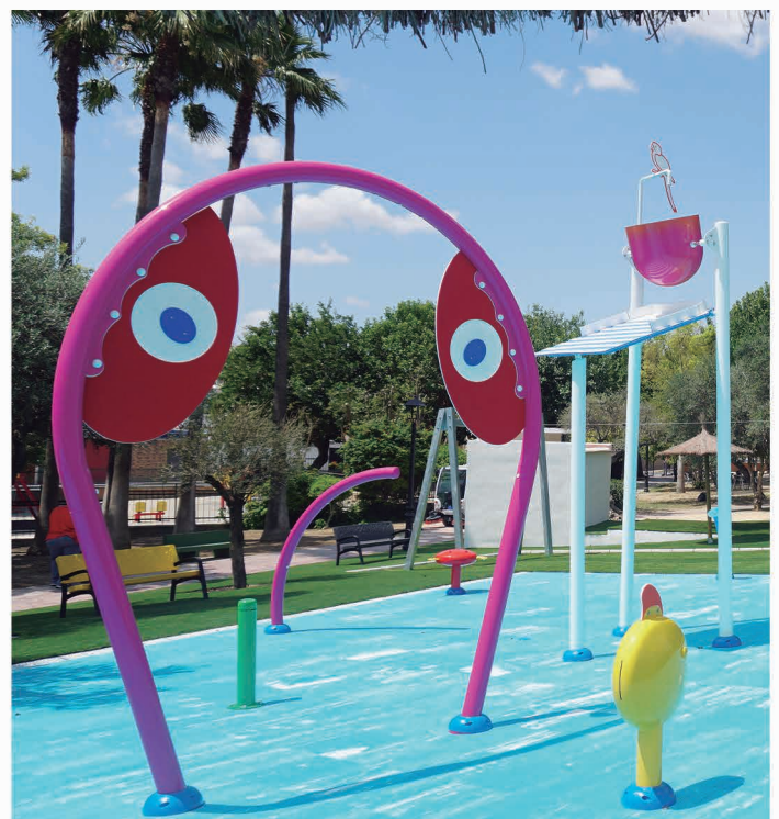
Juegos de agua del Parque de los Olivos. Horario: de Lunes a Domingo de 11:30h a 14:30h y de 17:30h a 21:00h.