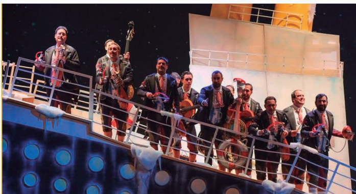
Chirigota del Bizcocho.