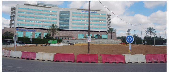
Glorieta D. Ángel Domínguez Pediatra.

E l Ayuntamiento ha desarrollado diferentes obras de remodelación en entornos y rotondas de los accesos a Castilleja de la Cuesta para facilitar a los vehículos la circulación y mejorar la seguridad vial.