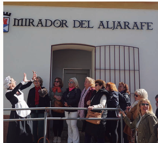
Coria del Río visita Castilleja de la Cuesta.

Además, la Oficina Municipal de Turismo está impulsando dos programas para la dinamización turística y económica del municipio: 'Conoce tu pueblo', dirigido a vecinos y vecinas, y 'Conoce Castilleja de la Cuesta', enfocado a visitantes de toda la provincia.