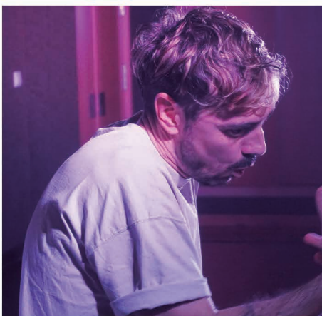
Obra de teatro Neurotímico .