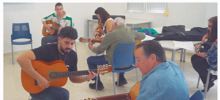
Taller de guitarra.