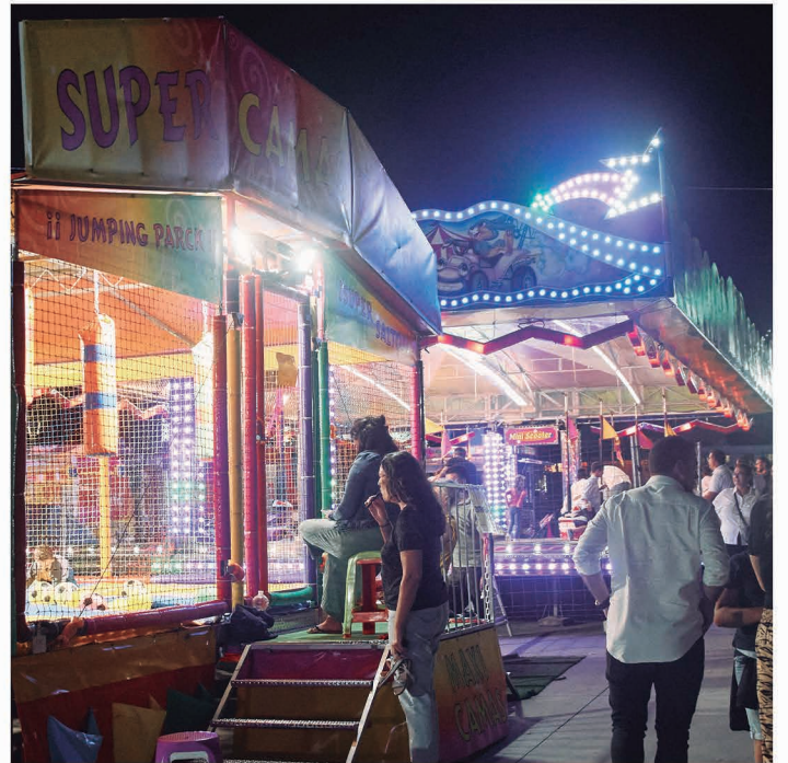
Zona de atracciones Feria de Castilleja de la Cuesta 2023.

Bares y restaurantes del municipio dispondrán de zonas acotadas en el recinto ferial para que vecinos/as y visitantes degusten lo mejor de la gastronomía local.