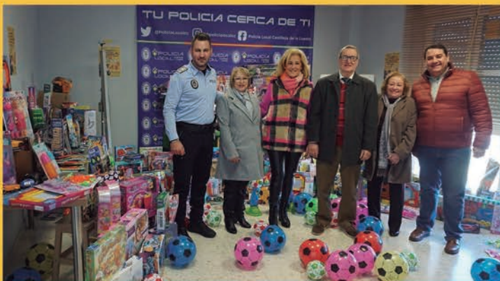
Entrega a Cáritas de los juguetes recogidos en la campaña solidaria