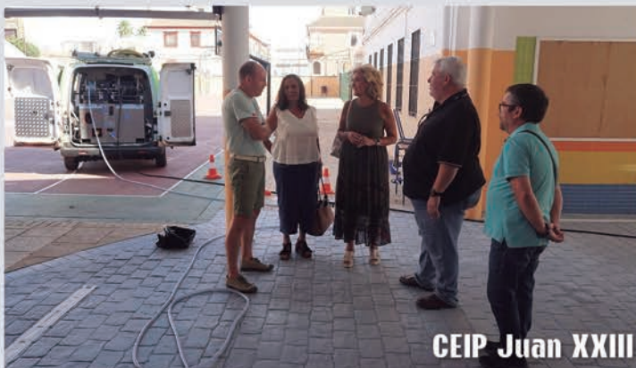
CEIP Juan XXIII