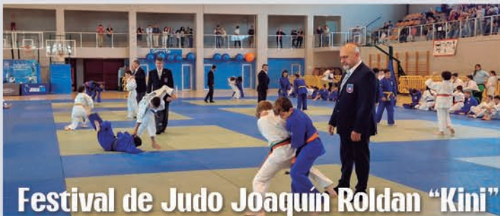
Festival de Judo Joaquin Roldan "Kini"