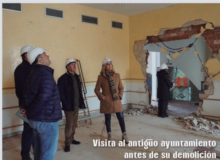
Visita al antiguo ayuntamiento antes de su demolición