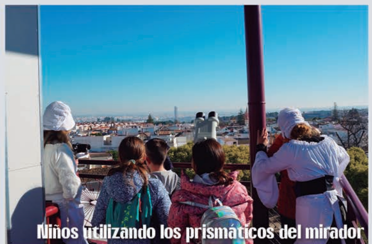
Niños utilizando los prismáticos del mirador