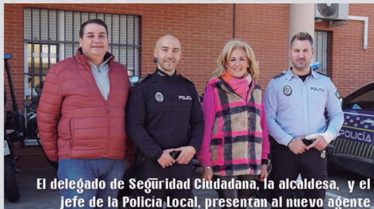
El delegado de Seguridad Ciudadana, la alcaldesa, y el jefe de la Policía Local, presentan al nuevo agente

La Policía Local contará con seis nuevos agentes, una vez finalicen los distintos procesos selectivos, que se sumarán a los cinco que ya se incorporaron en la pasada legislatura. El objetivo es continuar con el refuerzo que viene realizando el Ayuntamiento en materia de Seguridad Ciudadana.