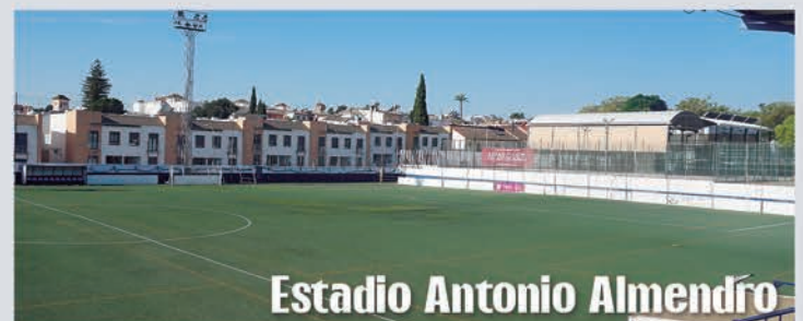
Estadio Antonio Almendro