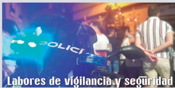
Labores de vigilancia y seguridad