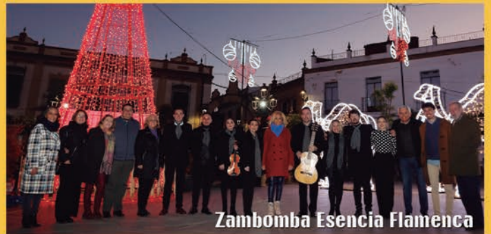
Zambomba Esencia Flamenca