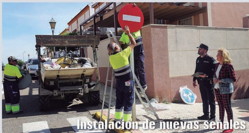
Instalación de nuevas señales