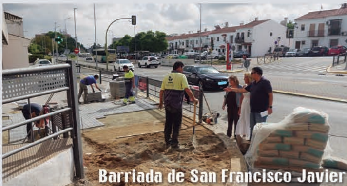
Barriada de San Francisco Javier

Tras el importante plan de inversiones realizado en la pasada legislatura, gracias al remanente, a los EDUSI y al Plan Contigo, el Ayuntamiento continúa con un gran número de proyectos en calles y barriadas que mejoran la accesibilidad y el entorno. Actualmente, se han llevado a cabo obras de mejora de acerados de zonas comerciales de la Barriada de Nueva Sevilla y de la Barriada de San Francisco Javier. Asimismo, se está mejorando el entorno de la glorieta de Aljaportil, el acceso al municipio por la Avenida Donantes de Sangre y de Órganos, que va a la Avenida Antonio Mairena y a las calles Pepe Valencia y Manuel Cansino Vélez, y la glorieta D. Ángel Domínguez Pediatra.