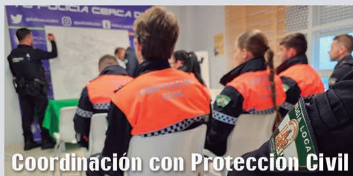
Coordinación con Protección Civil