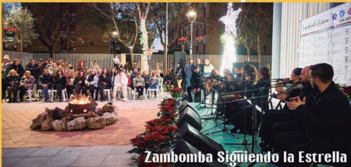
Zambomba Siguiendo la Estrella