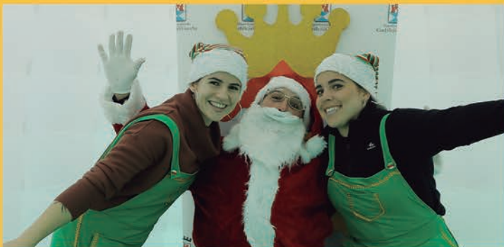
La Casa de Papá Noel