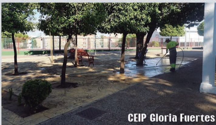
CEIP Gloria Fuertes

El Ayuntamiento ha realizado, como cada año, la puesta a punto de los cuatro colegios públicos de Castilleja de la Cuesta para que niños y niñas iniciaran el curso 2023/2024 con todo preparado. En concreto, se realizaron trabajos de albañilería y electricidad; se revisó la climatización de los centros; se llevaron a cabo trabajos de desinsectación, labores de limpieza y desinfección en todas las instalaciones, además de trabajos de fontanería y de pintura en clases y exteriores.