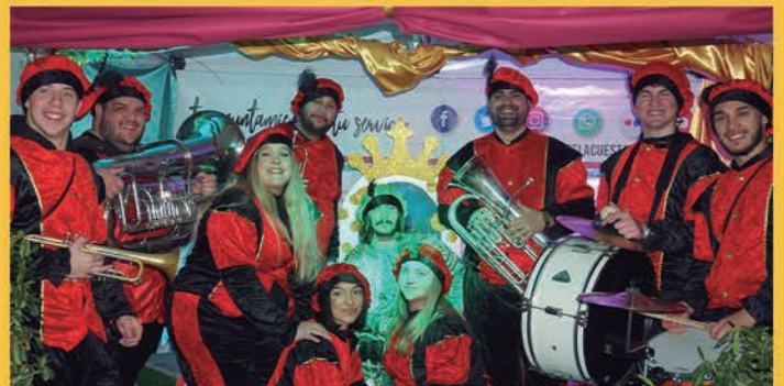
El Cartero Real