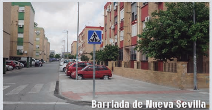
Barriada de Nueva Sevilla