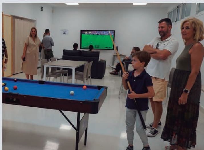
Sala de Juegos con mesa de billar