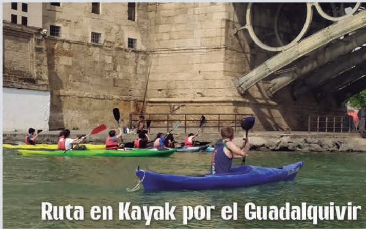
Ruta en Kayak por el Guadalquivir