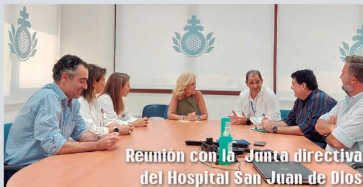
Reunión con la Junta directiva del Hospital San Juan de Dios