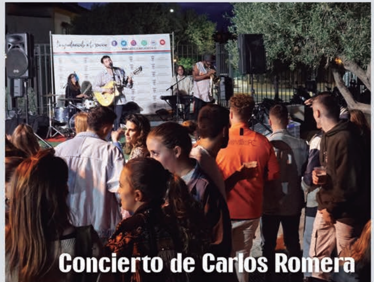
Concierto de Carlos Romera