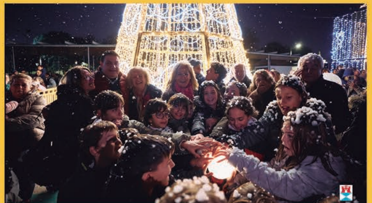
La Luz de la Navidad llegó a nuestro pueblo el 4 de diciembre