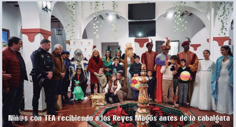
Niñ@s con TEA recibiendo a los Reyes Magos antes de la cabalgata

Miles de vecinos y vecinas volvieron a disfrutar de unas fiestas navideñas cargadas de música y actividades para los más pequeños. Volvió el mercado navideño, las tradicionales zambombas a la Plaza de Santiago y al Centro Cívico y Social. También visitaron Castilleja de la Cuesta Papa Noel, el Cartero Real y Sus Majestades los Reyes Magos, que llenaron de alegría e ilusión las calles de nuestro pueblo en la Gran Cabalgata.