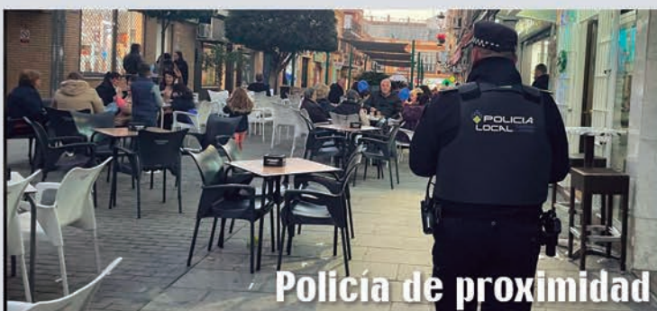
Policía de proximidad