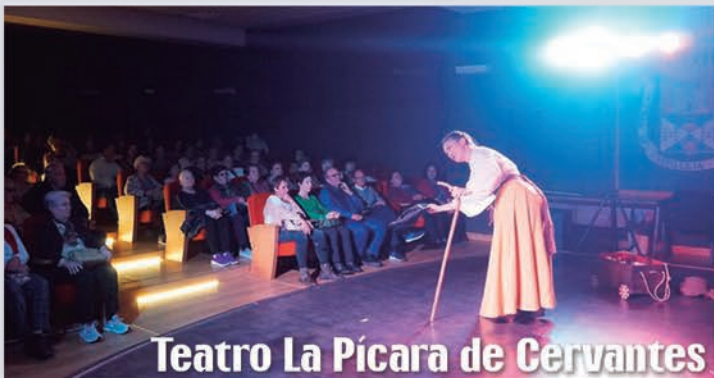
Teatro La Pícarra de Cervantes