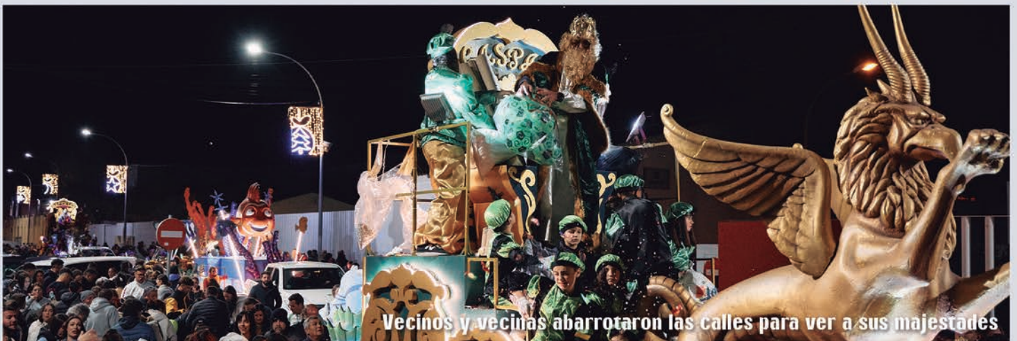
Vecinos y vecinas abarrotaron las calles para ver a sus majestades