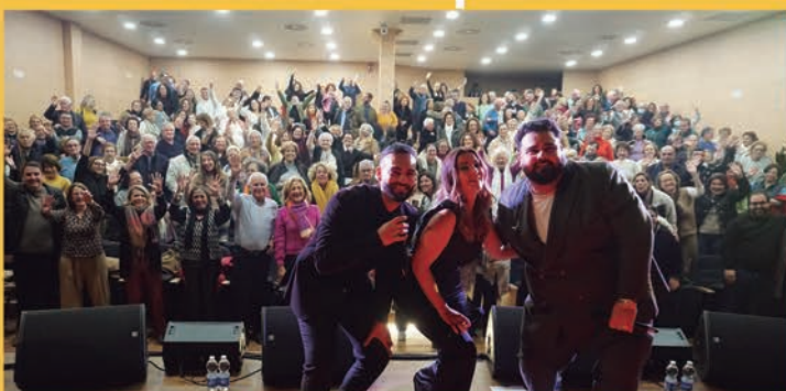
Concierto Toma Navidad