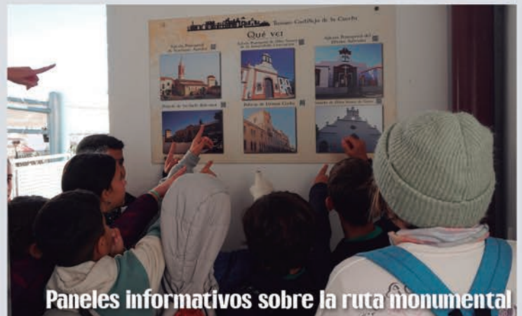
Paneles informativos sobre la ruta monumental