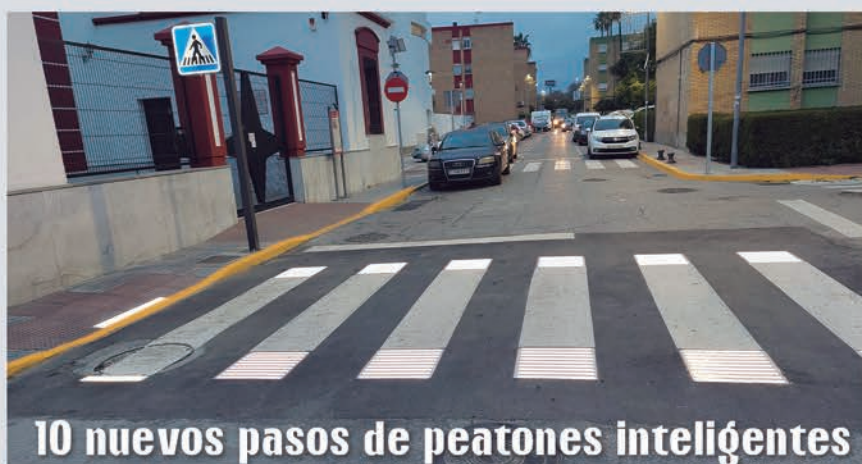
10 nuevos pasos de peatones inteligentes