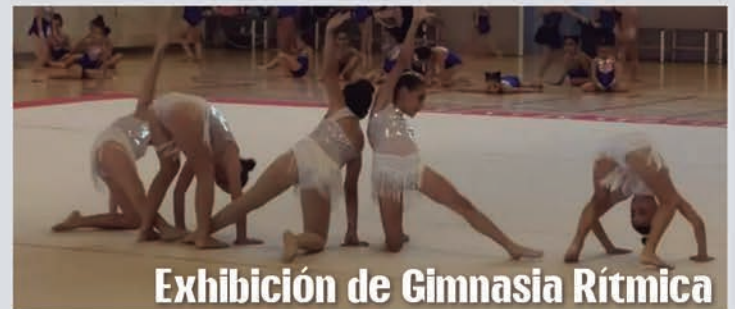
Exhibición de Gimnasia Rítmica

El Ayuntamiento continúa realizando labores de mantenimiento en las distintas instalaciones deportivas. En los últimos meses, se han realizado trabajos tanto en el Estadio Joaquín Rodríguez Morilla como en el Estadio Antonio Almendro, así como el arreglo del césped en este último.