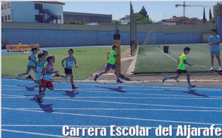
Carrera Escolar del Aljarafe

¿Sabes que aún puedes inscribirte en algunas escuelas municipales?