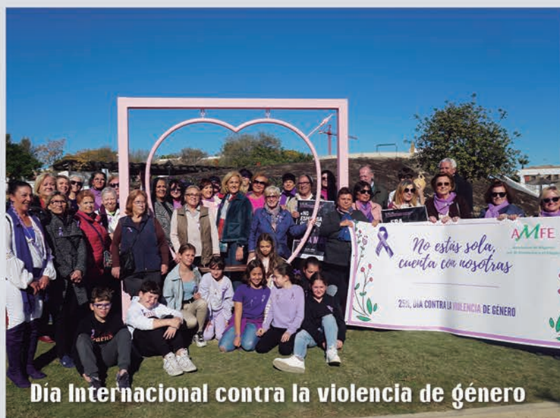
Día Internacional contra la violencia de género

Como cada año, vecinos y vecinas se han volcado en las actividades impulsadas para promover la igualdad y la solidaridad. Un 25 de noviembre más, Castilleja de la Cuesta volvió a recordar a las víctimas de la violencia machista.