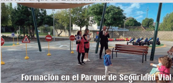
Formación en el Parque de Seguridad Vial