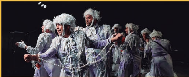
Chirigota del Bizcocho

Castilleja de la Cuesta vivió en septiembre cuatro días espectaculares de Feria, en los que la música, la gastronomía y el buen ambiente fueron los protagonistas. El Ayuntamiento organizó actividades (Zona Juvenil, ludoteca, atracciones, actividades para los coles) y nueve conciertos para todas las edades. Miles de vecinos/as y visitantes pasaron por el recinto ferial entre el 14 y el 17 de septiembre. El Ayuntamiento agradece la "enorme acogida" de esta edición e informa de que "ya trabaja en la Feria 2024".