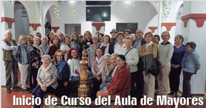
Inicio de Curso del Aula de Mayores