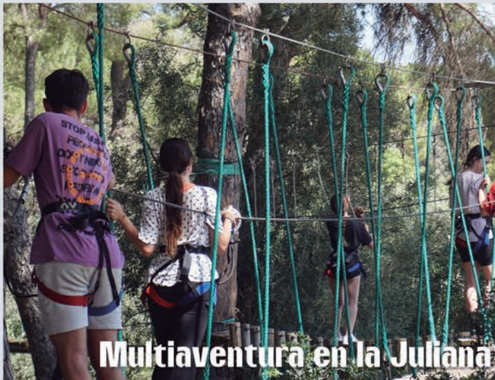
Multiaventura en la Juliana