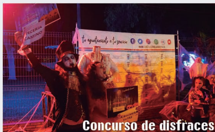
Concurso de disfraces