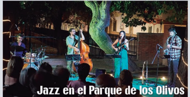
Jazz en el Parque de los Olivos