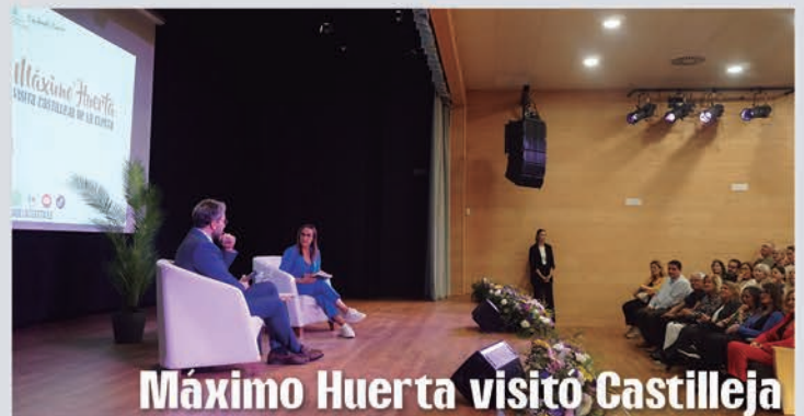
Máximo Huerta visita Castilla de la Cuesta