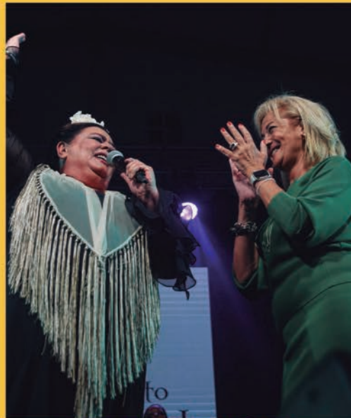
Concierto de Maria del Monte