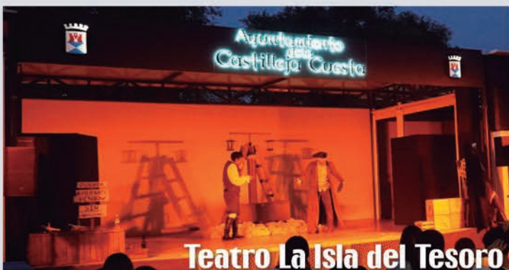
Teatro La Isla del Tesoro