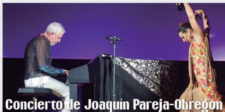
Concierto de Joaquín Pareja-Obregón