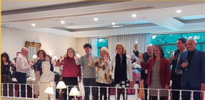
Convivencia de mayores