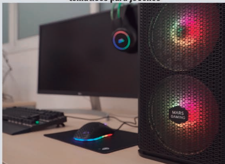
Ordenadores de última generación para jugar en cooperativo