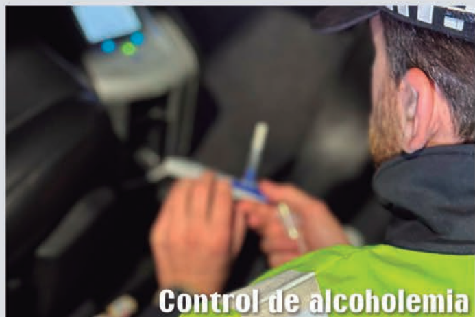
Control de alcoholemia

La Policía continúa desarrollando la necesaria labor de vigilancia, seguridad y control por todo el municipio, así como campañas informativas y de sensibilización, como la que realiza con niños y niñas en el nuevo Parque de Educación Vial.