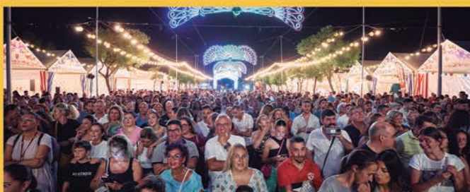
Miles de personas asistieron a los conciertos