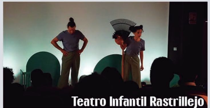
Teatro Infantil Rastrillejo